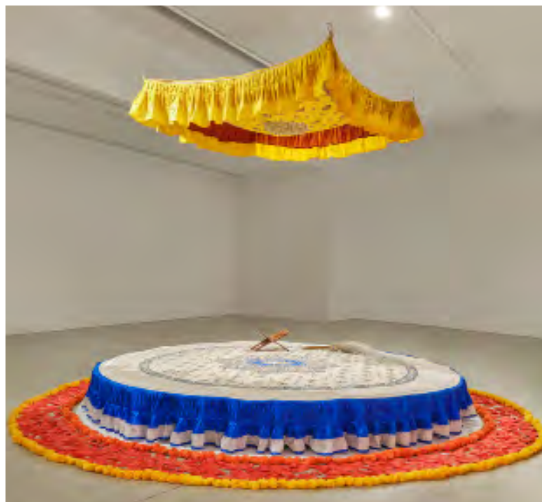
Simranpreet Anand, Bande chasm deedn fanaai , 2021