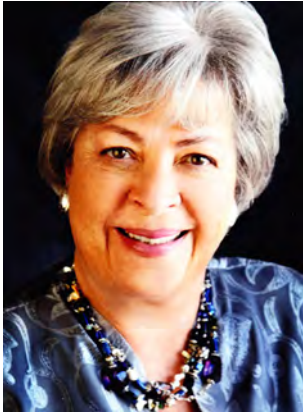
Gerda Hnatyshyn, C.C.

Comme plusieurs, j'ai été quelque peu soulagée de dire adieu à l'année 2021. Comme en 2020, la pandémie de COVID-19 a exercé une pression énorme sur de nombreux Canadiens et a mis sur pause la vie de tant d'autres.