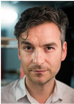
Marcel Dzama Winnipeg (Manitoba)

En recommandant Marcel Dzama pour le Prix en arts visuels de la Fondation Hnatyshyn, le jury a souligné le large éventail et la profondeur des récits qui ont vu le jour depuis qu'il a été découvert pour les dessins qui le distinguent désormais. Particulièrement évidentes dans des pièces combinant divers médias, incluant ses récents tableaux de céramique à grande échelle et ses films ambitieux, les œuvres de Dzama révèlent une lecture plus dure et davantage politisée combinant des histoires personnelles alignées avec les stratégies du début du modernisme. Une telle sophistication captivante déjouée par l'imprévisible apporte un air nuancé à plusieurs niveaux à ses sujets tout en suscitant une résonance avec notre monde contemporain.